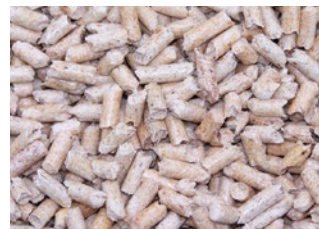
Drei verschiedene Formen des Energieträgers Holz: Scheitholz, Hackschnitzel und Pellets